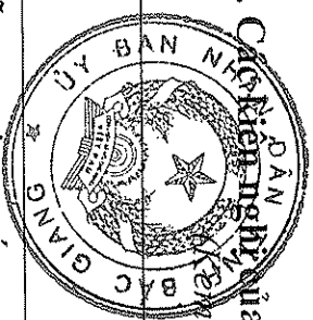
Biểu 04. Các kiến nghị của cử tri trước và sau kỳ họp thứ 6, HĐND tỉnh khóa XVIII đã được xem xét, giải quyết xong theo Báo cáo số 80 /BC-UBND ngày 30/5/2019 của Chủ tịch UBND tỉnh